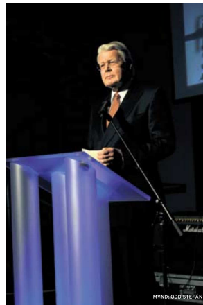
ÁVARP RÁÐSTEFNUNA Forsetinn sagði ljóst að nýsköpun frá grunnskólaþekkingu til starfsemi fyrirtækja væri vettvangur öflugs og hugmyndaríks fólks.

Ári nýsköpunar var ýtt úr vör í salarkynningu Marels í Garðabæ. Forsetinn sagði þetta vel við hæfi enda væri Marel í forystu á heimsvísu með starfsemi sem eigi sér rætur í „nýsköpun manna sem sáu tækifæri í samskiptum náttúru og atvinnu- greinar sem Íslendingar höfðu stundað frá landnámsstö. Marel er líka vettvangur sem varpar ljósi á tækifærin sem urðu til við hruð bankanna – þótt þeim kunni að þykja einkennilegt að taka þannig til orða.“ sagði forsetinn og benti á að mörg fyrirtæki hefðu eftir hruð getað ráðið til sín hámenntað fólk sem bankarnir hefðu láfað til sín með gylliboðum.